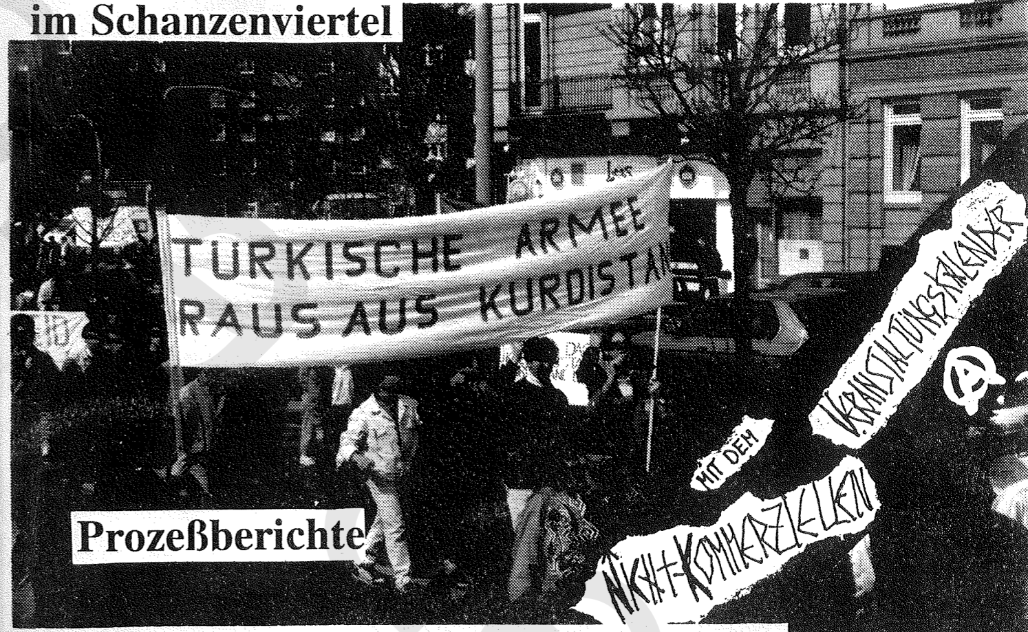
11.4.92: Solidaritätsdemo für das Kurdische Volk im Schanzenviertel