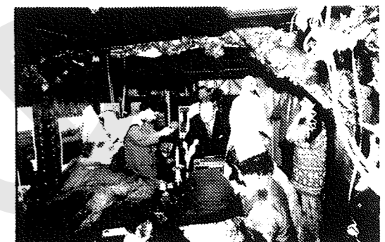
Dabelstein im Kreise der Karnevalisten