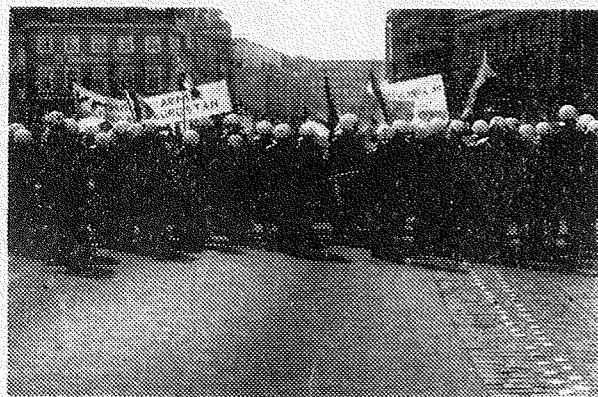
Polizeiaufmarsch am 11.4.92

Am 4.4.1992 demonstrierten nationalistische und faschistische Türken – etwa 4000 – durch unser Viertel für den Kriegt gegen das kurdische Volk. Unter den Augen und zum Teil mit Hilfe der Polizei griffen sie das (kurdische) Volkshaus im Neuen Kamp an, den Buchladen Yol in der Schanzenstraße und einen kurdischen Imbiß in der Susannenstraße. Zu dieser Demonstration hatten auch die türkischen Sozialdemokraten aufgerufen. Die Angriffe aus der Demonstration heraus wurden offensichtlich von Mitgliedern des türkischen Geheimdienstes gelenkt